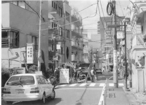
商店街（地区内幹線道路）を見るときはの着眼点