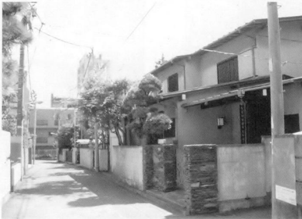
住宅地（細街路）を見るときはの着眼点